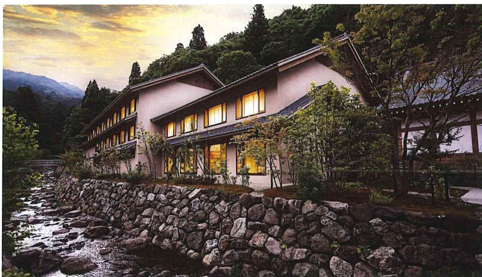
黒龍酒造 ESHIKOTO 水野社長による施設案内 説明