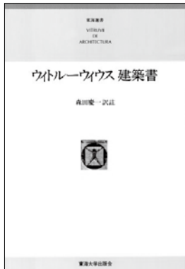
世界最古の建築の言葉 2000年前の建築家ウィトルウィウスによる 『建築書』(ラテン語) 森田慶一訳:東海大学出版会1979

「家」は単に材木や土の集積ではなくして「住居」であり、住居としてすでに人間存在を表現している。「家」という言葉が通例家族共同態を言い現わしているように、家の構造は通例家族的なる人間存在を表現する。